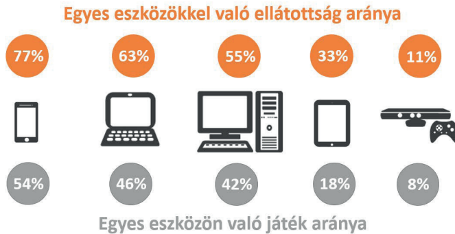
2. ábra: Eszközellátottság és videojáték-platformok (eNET online kutatás, 2017. augusztus, 18 és 65 év közötti népesség, VeVa online kutatási közösség; akik játszanak videojátékkal, N=569)