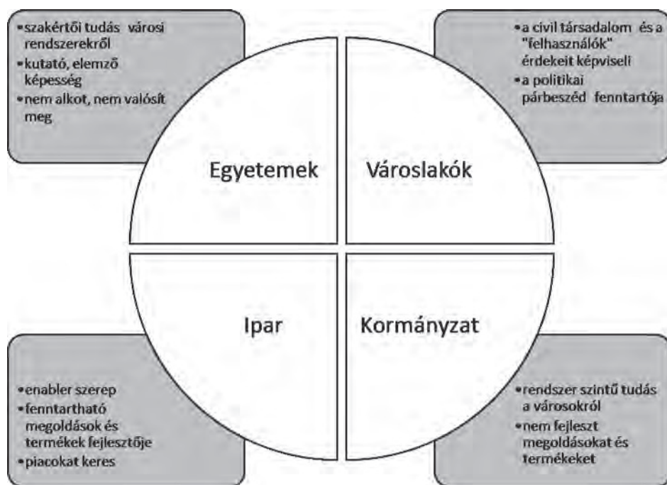
1. ábra: Okos város ökoszisztéma szereplői (Carayannis és Campbell 2009 nyomán)

A városok világszerte eltérően viszonyulnak az okos fejlesztések kereteinek meghatározásához. Ez nyomon követhető egyrészt a stratégiák ágazati meghatározottságában (egy specifikus területen foglalkoznak-e smart megoldásokkal vagy általánosan), másrészt az eszközök megválasztásában (kizárólag digitális, infokommunikációs vagy szélesebb körű, gyakran "puha" megoldások alkalmazása), illetve a döntéshozatali folyamatok szervezésében is (felülről irányított, például dashboard-rendszerű városmenedzsment, vagy közösségi alapú, alulról építkező rendszer, vagy ezek ötvözete). Egyes vezető települések külön okos vagy digitális stratégiát alkotnak (például Barcelona 2 ), mások a városfejlesztési stratégiáikat bővítik ki vagy írják teljesen újra (például Bécs 3 ) akár a hagyományosnak nevezhető fenntarthatósági és életminőségi célok mentén, akár új célok megfogalmazásával (például Gent 4 ).