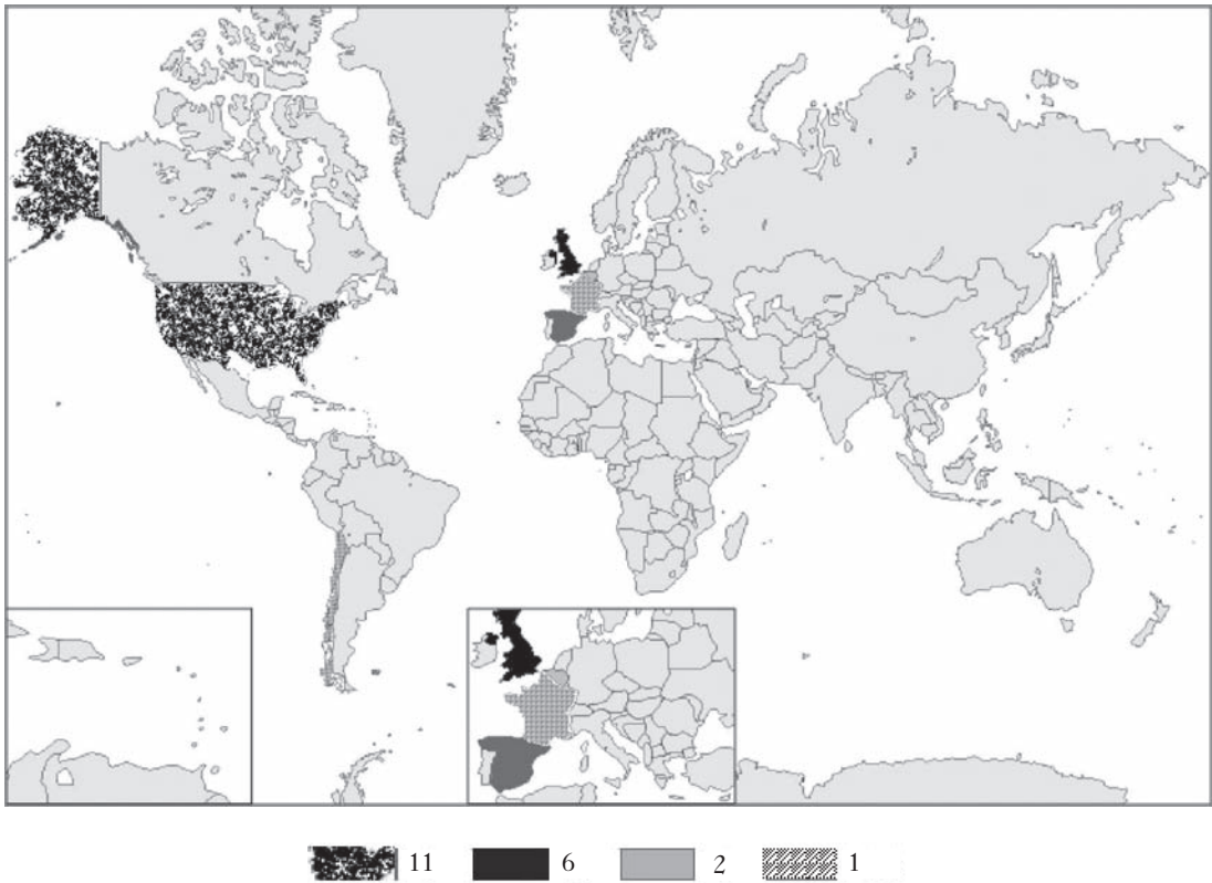
3. ábra A vizsgált kutatásokhoz biztosított összes támogatás és forrás száma országonként