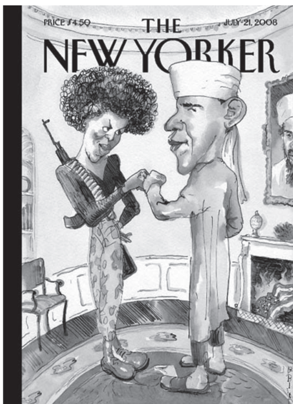
1. kép. Barack és Michelle Obama képe a New Yorker 2008. júl. 21-ei címlapján 9

A kép érdekessége, és Rahman is ezt emeli ki (2010, 944-945. o.), hogy az ábrázolás sajátosságai okán a „muszlim” és az „amerikai” egymást szimbolikusan kizáróként van ábrázolva, amely szembenállást a kandallóban égő amerikai zászló reprezentálja. Más elemek (az automata gépkarabély és a töltényheveder Michelle-en, egybevéve a kandalló fölé kiakasztott Oszama bin Laden-képpel) szintén alkalmasak a muszlimok agresszív Amerika-ellenességének sztereotipizálására.