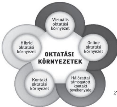
2. ábra: Az oktatási környezetek felosztása (Ollé 2013)